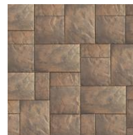
Sable désertique T & U