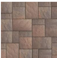
Aube T & U