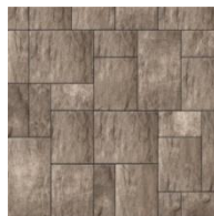
Chêne brun T & U