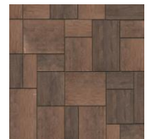
Sycamore T & U