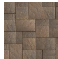
Sierra T & U