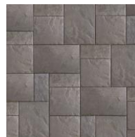
Granit T & U