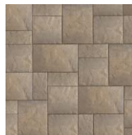
Galet de mer T & U