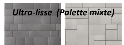
Ultra-lisse (Palette mixte)