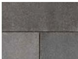
SENZO™ Fini mat