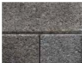
SERIES 3000® Fini agrégats Granit et Quartz