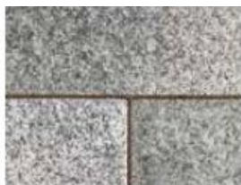
UMBRIANO® Fini granit