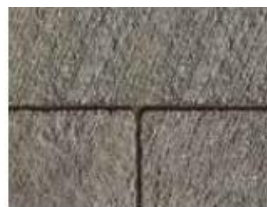
IL CAMPO® Fini brossé