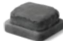
2 \frac{3}{8} " x 5 \frac{1}{8} " x 5 \frac{3}{4} " 60 x 130 x 145mm