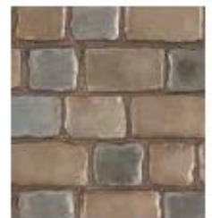
Brume de mer & Taupe Assinica (vendu séparément)