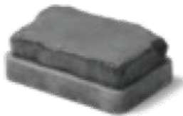
2 \frac{3}{8} " x 5 \frac{1}{8} " x 8 \frac{3}{8} " 60 x 130 x 215mm