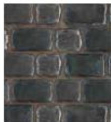
Basalte & Bleu belge (vendu séparément)