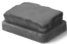
2 \frac{3}{8} " x 5 \frac{1}{8} " x 7 \frac{1}{4} " 60 x 130 x 185mm