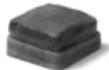
2 \frac{3}{8} " x 5 \frac{1}{8} " x 5 \frac{1}{8} " 60 x 130 x 130mm