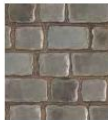
Brume de mer