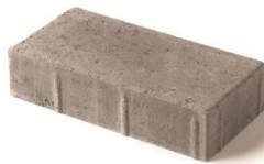
2¾" x 6" x 12" 70 x 150 x 300mm