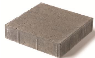
2¾" x 12" x 12" 70 x 300 x 300mm