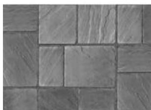
Brume de mer