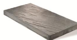
2 3/4" x 18" x 36" 70 x 450 x 900mm