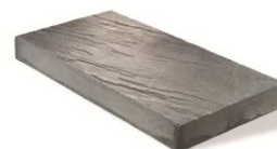
4" x 18" x 36" 100 x 450 x 900mm (commande spéciale)