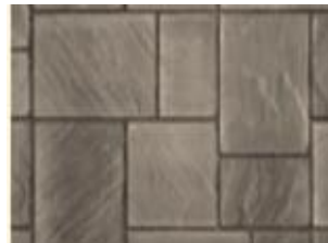
Deux couleurs (Vendu séparément)