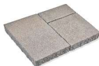
Galet de Mer