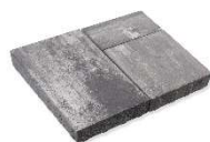
Fusion de Granit