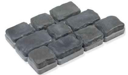
Brume de Mer / Dawn Mist*

REPLISSAGE / JOINTING : Lire les recommandations de remplissage des joints de la page 113 à 115. Contactez Rocvale pour plus d'information. / Read the joint filling sand advisory from page 113 to 115. Contact Rocvale for information.