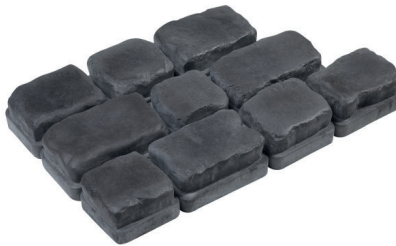
Bleu Belge / Belgian Blue*