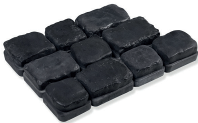
Basalte / Basalt

*Disponibile jusqu'à épuisement de l'inventaire / Available while quantities last.