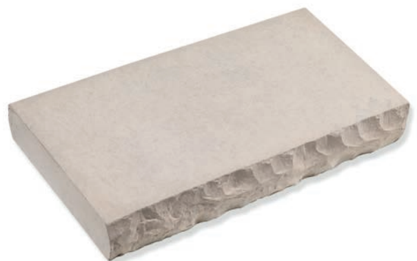
Chamois / Buff