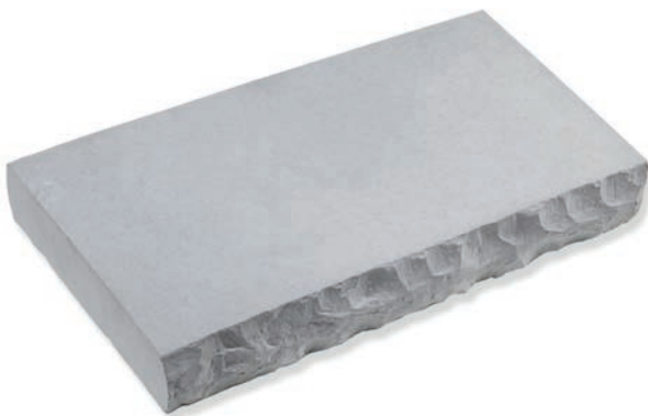
Ardoise / Coastal Slate